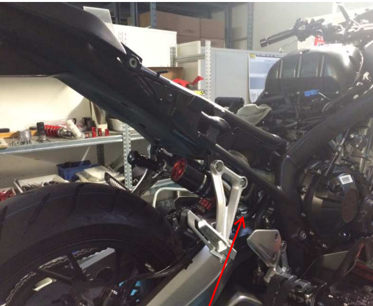
Tubo remoto serbatoio verso il basso