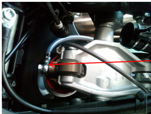
Posizione Amm. B