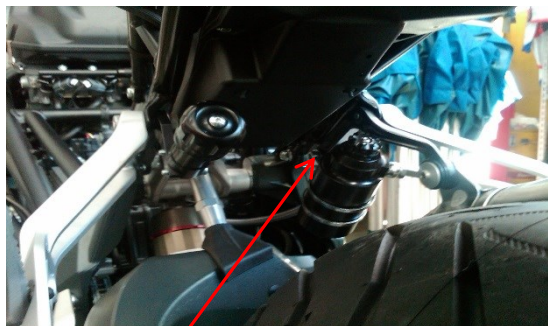
Staffa supporto serbatoio F