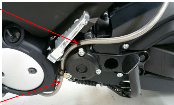
Tubo remoto F