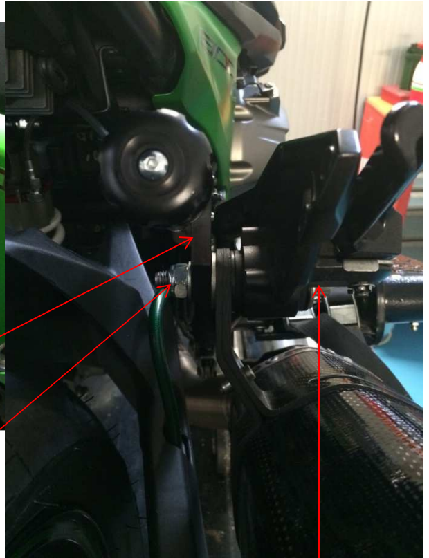
Vite M10x80 A